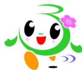
おもてなしキャラクター 「いっつん」