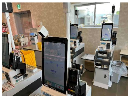
キャッシュレス決済対応レジ イメージ