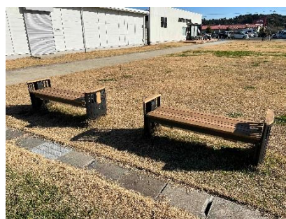
防災かまどベンチ イメージ