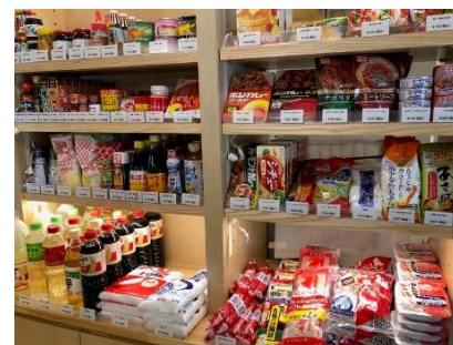
日用品売り場 イメージ