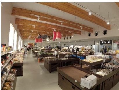
農産物販売所 イメージ