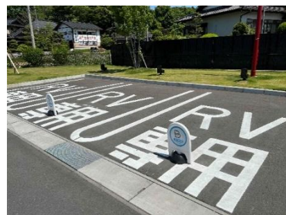
RV パーク イメージ