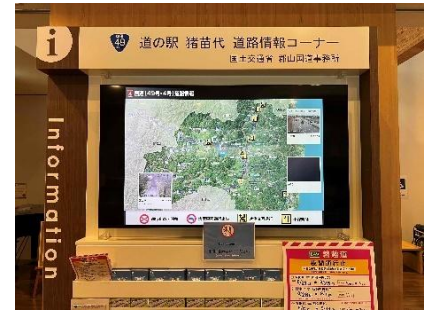
道路交通発信コーナー イメージ