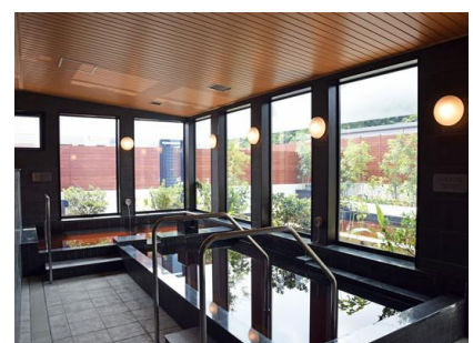
リラクゼーション施設 イメージ