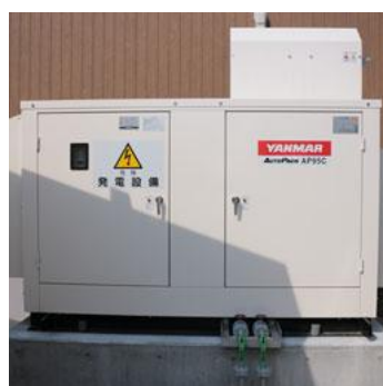
非常用電源 イメージ