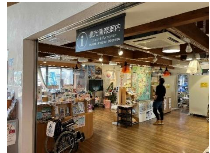
地域情報案内コーナー イメージ