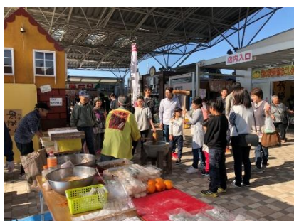
イベント開催 イメージ