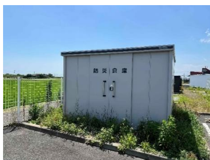
防災倉庫 イメージ