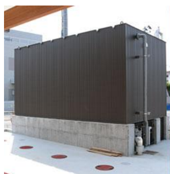
受水槽 イメージ