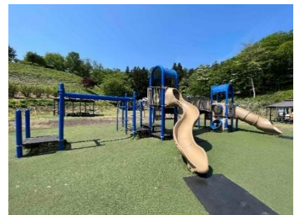
大型遊具 イメージ