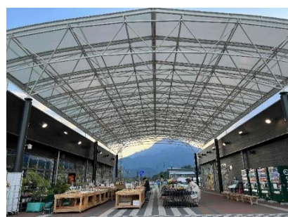
屋外多目的スペース イメージ