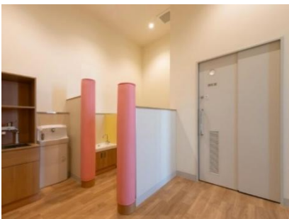
ベビーコーナー イメージ