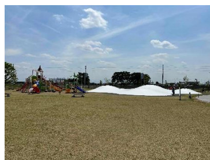
芝生広場 イメージ