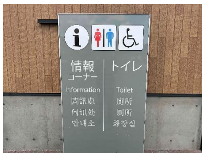
多言語対応案内板 イメージ