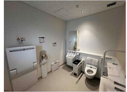
多機能トイレ イメージ