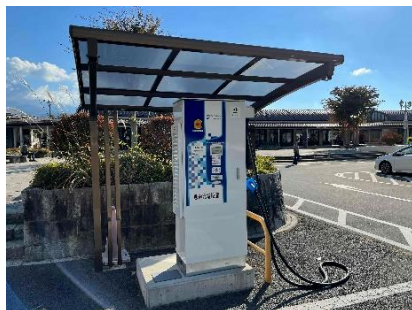
EV 充電設備 イメージ