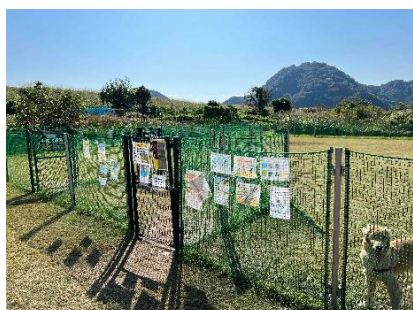
ドッグラン イメージ