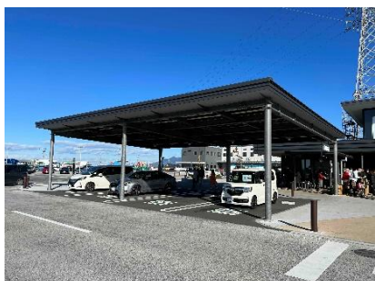
屋根付き優先駐車場 イメージ