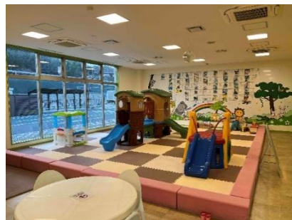
キッズスペース イメージ