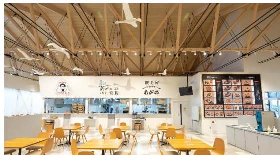
飲食施設 イメージ