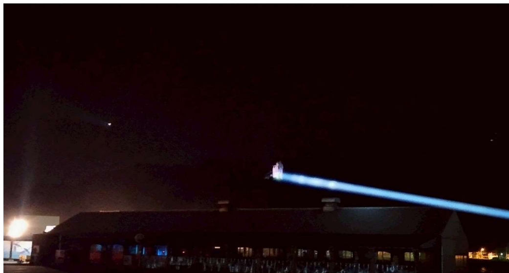
(サーチライトで照射した様子)