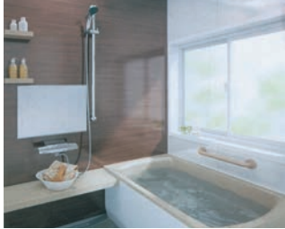
浴室・浴槽工事施工 素早く完成

建設業 千葉県知事許可(般-3)第18565号 産業廃棄物収集運搬業 千葉県知事許可 第1200069142号 産業廃棄物処分業 千葉県知事許可 第1220069142号 一般廃棄物収集運搬業 千葉県知事許可 第22号