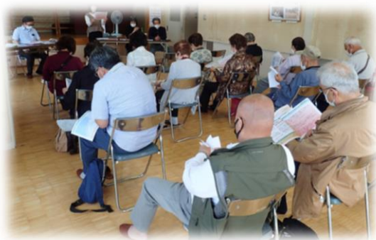
↑「ぷちバスわだち報告会」の様子