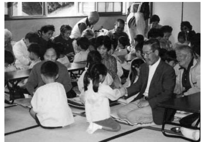
▲世代間交流も民生・母推の活動のひとつ