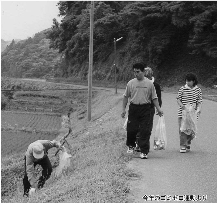
今年のゴミゼロ運動より

編集発行／富津市役所情報課 〒293-8506 0439-80・1225 千葉県富津市下飯野2443番地