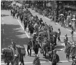
▲チャグチャグ馬コ