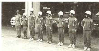
▲規律訓練中の中学生

「普段見たこともないことを体験できて勉強になりました」。参加した中学生たちの声。 大員中2年生13人が職場体験学習に消防署を選択しました。1日消防署員として、規律訓練や、救急法、救助訓練、放水訓練などを不安と緊張の面もちで体験しました。