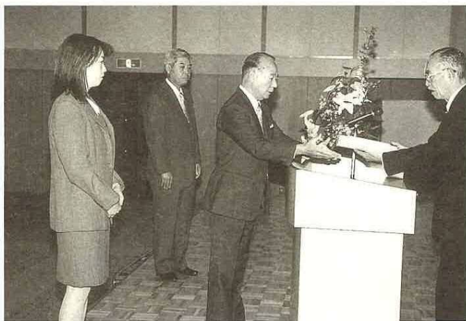
▲市長から表彰状と記念品を手渡される善行表彰の皆さん。