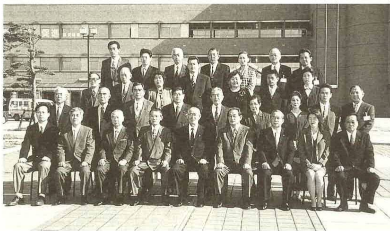
▲受表彰者の皆さんと市特別職