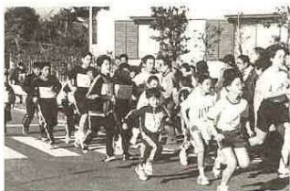
▲昨年の元旦マラソン大会

☆元旦歩こう大会 富津市教育委員会主催 集合場所・時間 ①富津公園 野外音楽堂午前10時 ②農村青少年研修センター午前10時 ③市役所天羽支所午前10時