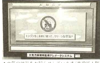
▲大気の状態をお知らせしています(市役所1階)

冷えて澄んだイメージのある冬の空気。でも、これから年末に向けての季節は、自動車交通量や暖房機の使用が増え、空気が汚れやすくなります。さらに、冷たい空気が地表付近の空気の上に重くのしかかり、地表の汚れた空気が上空に拡散されにくくなります。そのため、窒素酸化物(NOx)が高濃度となり、大気汚染の大きな原因になっています。NOxを抑制し、きれいな空を守るため、次の提案にご協力ください。 ①アイドリングストップを徹底しましょう。 ②暖房の温度設定は控えめにしましょう。 ③自動車の使用はできるだけ控えましょう。