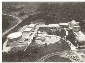
▲かずさパークの全景

日時 1月23日(水)午後1時10分～4時10分 集合場所 木更津駅西口バスロータリー 定員 35人 見学会コース かずさパーク・かずさDNA研究所 費用 無料