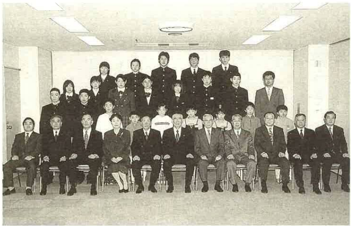
▲教育委員会表彰、受表彰者の皆さん