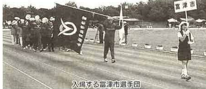
入場する富津市選手団

9月23日、県民体育大会の総合開会式が臨海陸上競技場で、大勢の観客の元、盛大に行われました。 富津市団体入賞 男子 新体操（優勝）、相撲（2位）、剣道（ベスト8）、空手道（ベスト8）、女子 なぎなた（7位）、空手道（ベスト8）