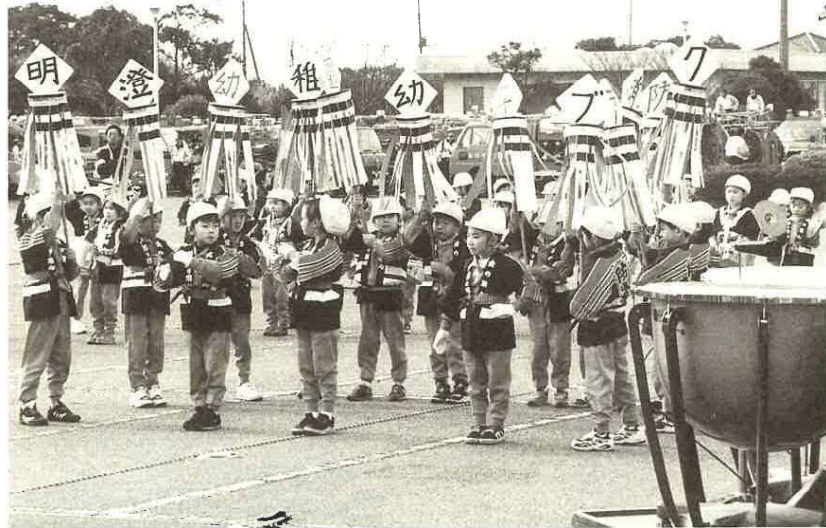
▲火災予防を訴える明澄幼稚園 幼年消防クラブの皆さん