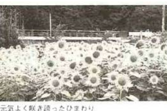
元気よく咲き誇ったひまわり