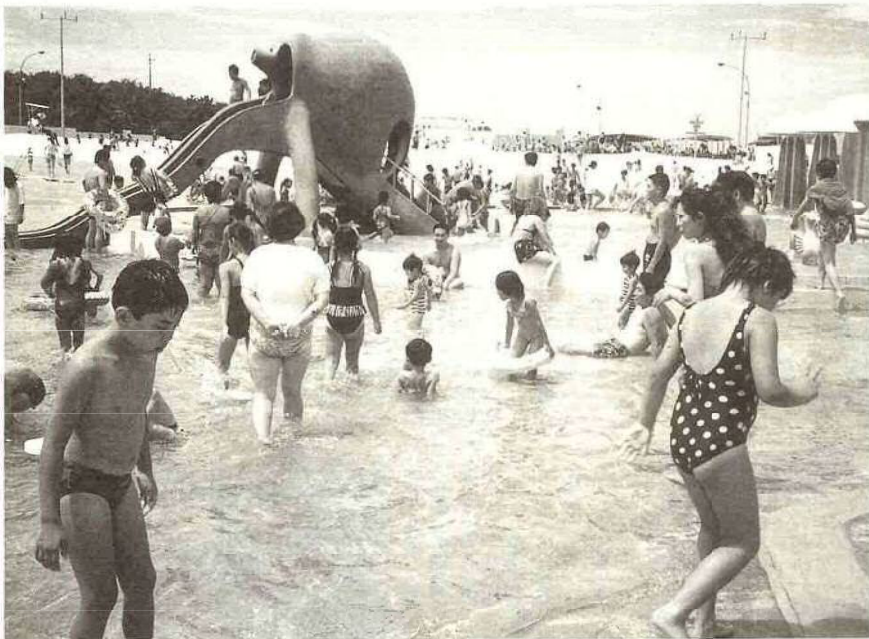
子どもたちでにぎわう「ちびっこプール」

編集発行／富津市役所秘書課 〒293-8506 ☎0439・80・1225 千葉県富津市下飯野2443番地