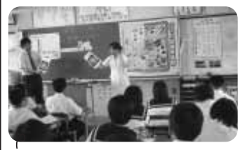
「朝食について考えよう」の授業 (富津中)