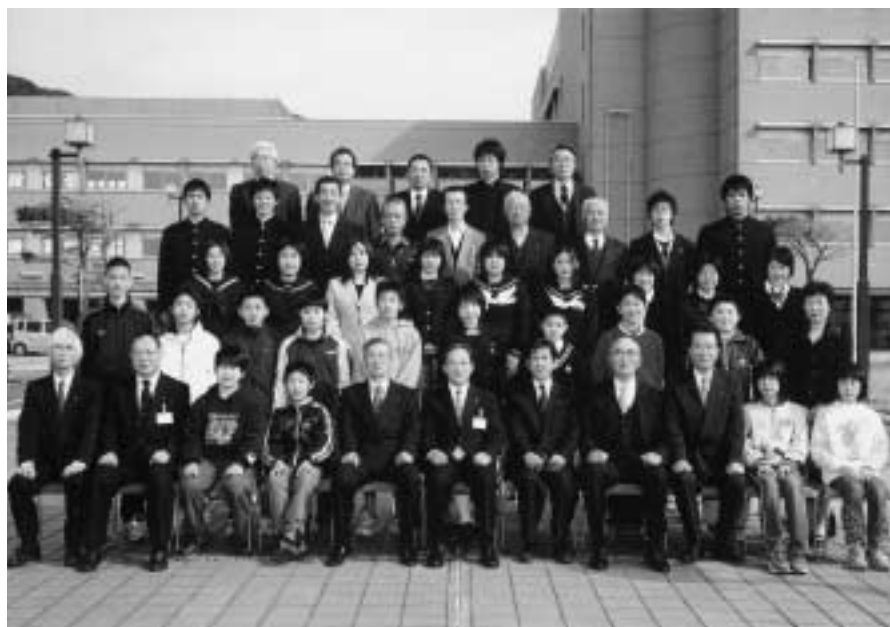
富津市教育委員会表彰の皆さん