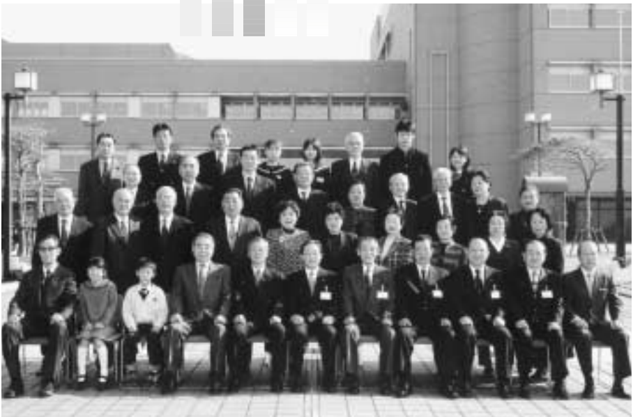
富津市表彰の皆さん