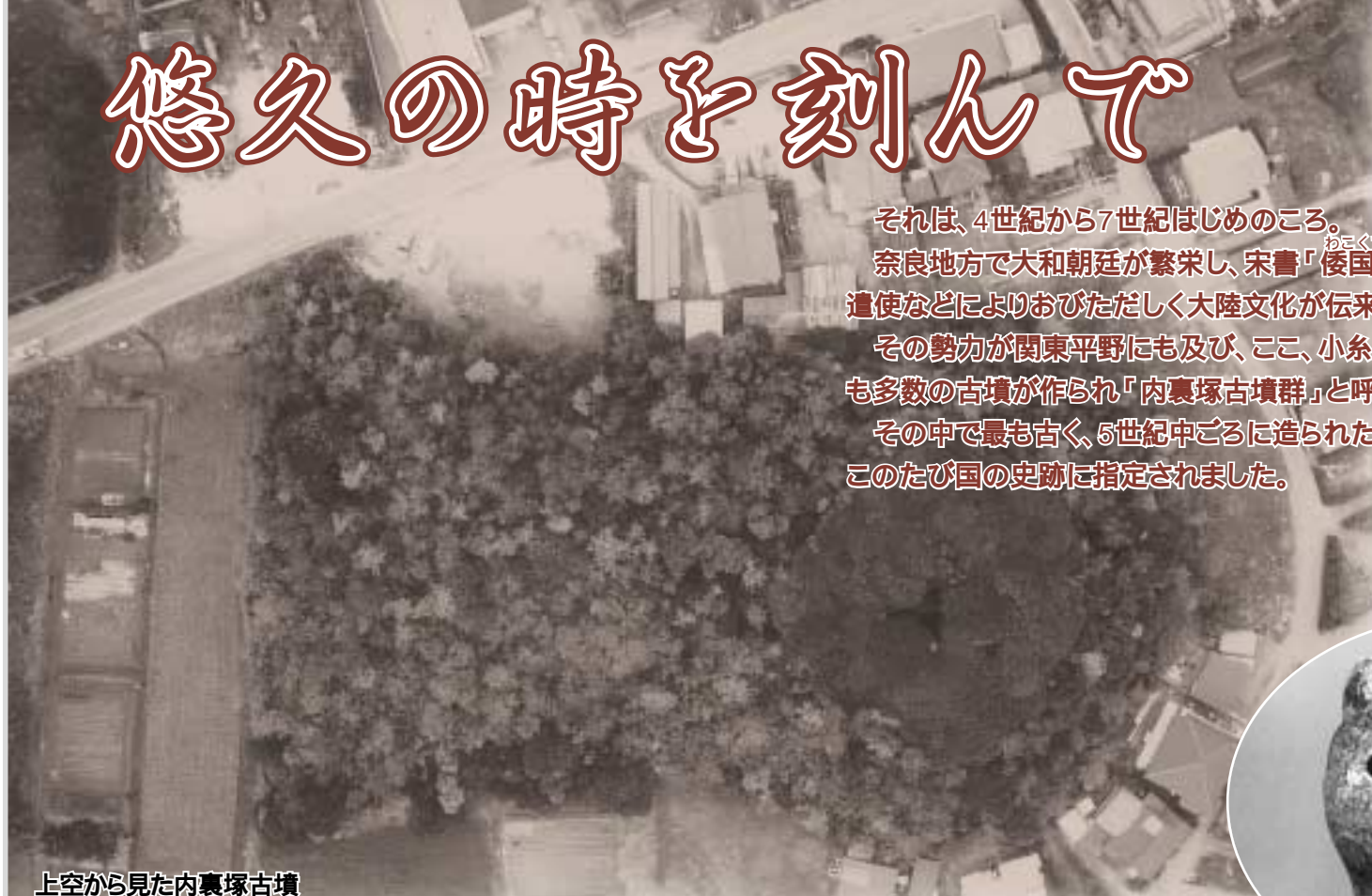
上空から見た内裏塚古墳

それは、4世紀から7世紀はじめのころ。 奈良地方で大和朝廷が繁栄し、宋書「倭国伝」に記されている倭王の遣使などによりおびただしく大陸文化が伝来しました。 その勢力が関東平野にも及び、ここ、小糸川下流域の「飯野平野」にも多数の古墳が作られ「内裏塚古墳群」と呼ばれています。 その中で最も古く、5世紀中ごろに造られたとされる「内裏塚古墳」が、このたび国の史跡に指定されました。