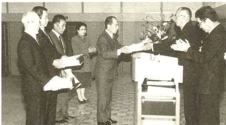
市長から表彰状と記念品を手渡される受賞者

市政などの発展に貢献された47人(団体含む)の表彰を受けられた皆さんを紹介します。(敬称略)