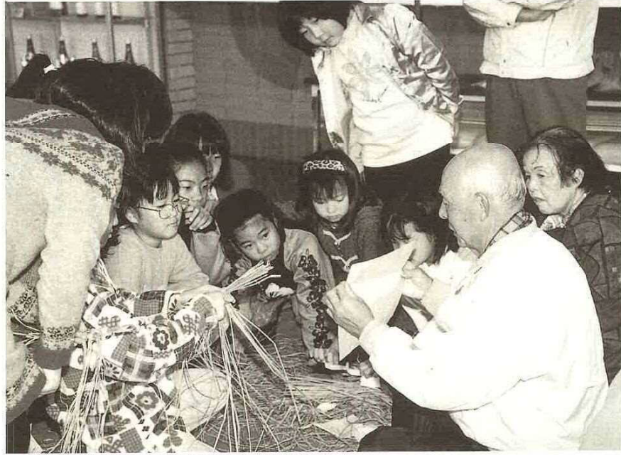
お正月用のお飾りづくり（昨年の富津公民館での教室）

○水道・消防業務 年末・年始を問わず、24時間体制で対処します。 ☆漏水や断水など事故が発生したときは水道部へ ☎水道部 ☎66・2246 ☆火事や急病などの救急は、119番へ。 ☎消防本部 ☎65・0119