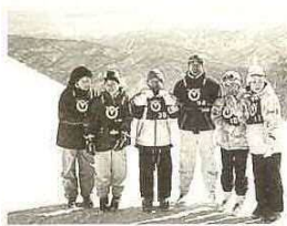
▲昨年の市民スキー

☆元旦歩こう大会 富津市体育指導委員連務協議会主催 集合場所・時間 ①富津公園 野外音楽堂午前10時 ②農村青少年研修センター午前10時 ③市役所天羽支庁午前10時 ☆元旦マラソン大会 富津市体育協会主催 集合場所・時間 社会体育館前(大員)午前8時30分 種目 マラソン 男子5キロ、女子5キロ 小学生男子2・5キロ 小学生女子2・5キロ 中学生男子5キロ 女子5キロ 高校生男子10キロ 女子5キロ 50歳以上男子5キロ、女子3・4キロ 60歳以上男子3・4キロ、女子3・4キロ ☆新春クラウンドゴルフ大会 教育委員会主催 日時・場所 1月8日(日)午前9時集合 富津小学校運動場 種目 個人戦・中学生以上一般の部、小学生以下の部 対象 どなたでも ※申し込み バドミントン大会・マラソン大会は、12月17日(日)までに電話で、歩こう大会・クラウンドゴルフ大会は当日会場で。 富津市体育指導委員連務協議会では、市民スキー教室を次のとおり開催します。ご家族おそろいでご参加ください。