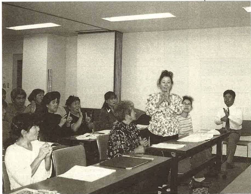
手話で自己紹介 (富津市総合社会体育館 平日コース)