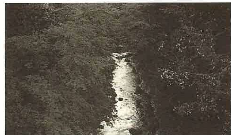
▲もみじもあざやかな志駒川

聴覚障害者のコミュニケーション方法は、障害の程度や内容によって違います。多くは、手話や口話、筆記、時には音声といった手段を場面や相手によって使い分けたり、併用したりしています。障害のない人とある人とのコミュニケーションでは、自