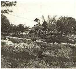
杵島山に造られた歌垣公園