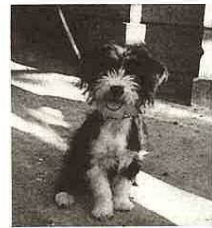
犬の放し飼いは条例で禁止されています！