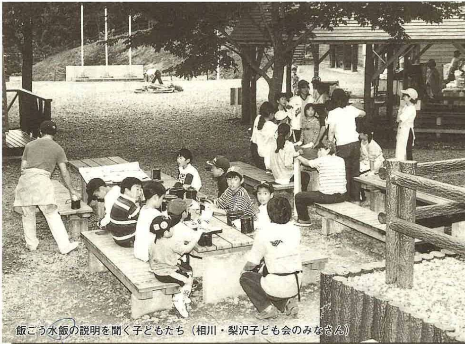
飯ごう水飯の説明を聞く子どもたち (相川・梨沢子ども会のみなさん)

編集発行/富津市役所秘書課 〒293-8506 ☎0439-80-1225 千葉県富津市下飯野2443番地