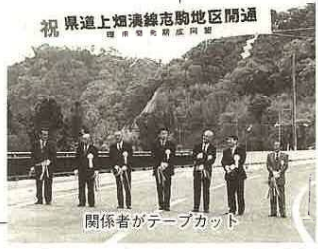
祝 県道上畑湊線志駒地区開通

大空に200匹のこいのぼりが泳ぐ中、市民の森フェスタが4月29日から5月5日まで、管理棟前広場で開催されました。五月晴れとなつた5月5日の子どもの日には、とんげやあま酒、牛乳などのサイビスのほか、こいのぼりくぐり競争、輪投げ大会など盛りだくさんの催しがあり、3500人の家族連れが楽しみました。