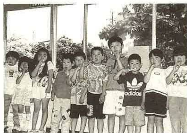
△食後は必ずみんなで歯みがき