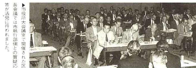
市役所大会議室で開催された区長会議では市執行部側との質疑応答が活発に行われました。