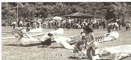
こいのぼりくぐり競争

大空に200匹のこいのぼりが泳ぐ中、市民の森フェスタが4月29日から5月5日まで、管理棟前広場で開催されました。五月晴れとなつた5月5日の子どもの日には、とんげやあま酒、牛乳などのサイビスのほか、こいのぼりくぐり競争、輪投げ大会など盛りだくさんの催しがあり、3500人の家族連れが楽しみました。