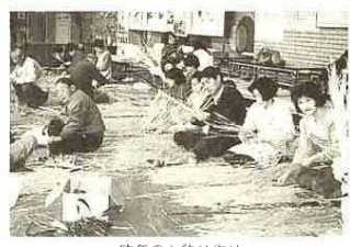
昨年のお飾り作り

日時 12月13日(日)午前9時～正午 場所 富津公民館 対象 どなたでも先着20人 内容 お正月の玄関飾りや輪飾りなどの作り方を、高齢者教室で学んだ人たちが親切に指導してくれます。 費用 材料費1500円 申し込み 11月29日(日)までに電話で 〇富津公民館 ☎87・8381