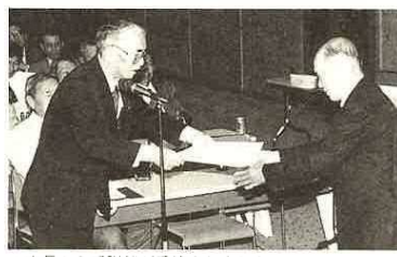
▲市長から感謝状が手渡されました。

市の区長制度は、昭和46年4月25日、3町が合併して富津町となった時点から「区長設