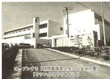
オープンする「特別養護老人ホーム金谷の里」「ケアハウスラクトピア」

全谷に建設中の「特別養護老人ホーム金谷の里」「ケアハウス・ラクトピア」「デイサービスセンター」の老人福祉施設3施設が6月16日にオープンします。「特別養護老人ホーム金谷の里」はねたきり老人が重度の痴呆老人のお世話をする施設で、市の福祉事務所へ申し込み手続きをし、入所できます。自己負担額は本人の収入や扶養義務者の年収額で決定されます。「ケアハウス・ラクトピア」は軽費老人ホームで安心費用で入居できる老人ホームです。利用料金は1回500円の手前です。ラクトピアにお申し込みください。デイサービスセンター「金谷の里」は市内3番目の送迎サービスの日帰り介護サービスを提供する施設です。天羽地区が送迎範囲となりますので、虚弱老人や痴呆老人、ねたきり老人で利用したい人は市の福祉事務所に申し出ていただきます。