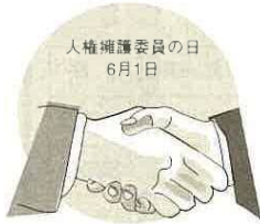
人権擁護委員の日 6月1日