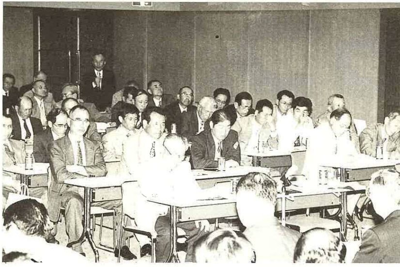
4月24日の区長会議では、市幹部と熱心な質疑応答が行われました。

今回は、皆さんの地区の区長さんと仕事の内容や報酬などを合わせてお知らせします。 問市民課 ☎80・1252