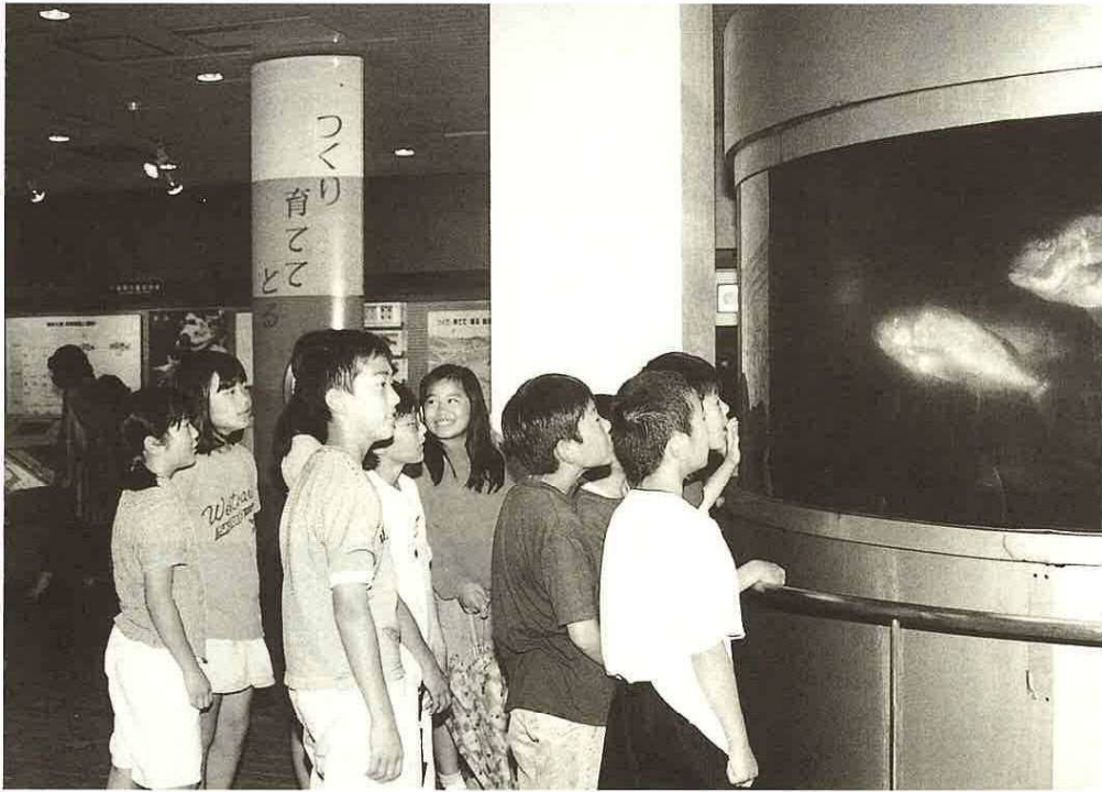
ロビーの展示コーナーで県の魚タイを見る天神山小学校5年生たち

現在、全国的に魚介類の種苗を大量に生産し海に放流して、成長させた後、漁獲する栽培漁業が積極的に行われています。 小久保にある県の施設「東京湾栽培漁業センター」では、クロダイ・ガザミ（ワタリガニ）・マコガレイをつくり育てています。