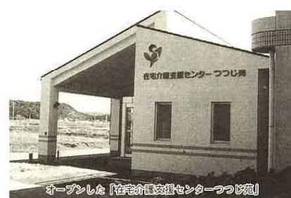
オープンした「在宅介護支援センターつじ苑」

家庭でねたきり老人や重度の痴呆性老人の介護にあたっては、家族や介護されている本人自身を応援するセンターが、上飯野にある「特別養護老人ホームつじ苑」に併設されました。この「在宅介護支援センターつじ苑」は保健婦と介護士が専門的な知識や関係機関とのネットワークをつつて、いろいろなサービスや福祉情報を提供する施設です。在宅で介護するための便利な介護機器(ベッドや床つれ