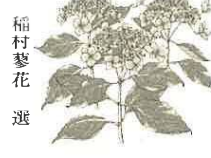
稲村 黎花 選