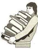
PTA・子供会・婦人会などが行う資源ごみ集団回収については、諸般の事情により4月から、本と雑誌を回収品目から除かせていただきますのでお知らせします。

なお、各世帯にお配りした「ごみの分け方・出し方」のなかで、資源ごみ集団回収の欄に、本・雑誌と記載されていますが、除かせていただきます。今後は、可燃ごみとして