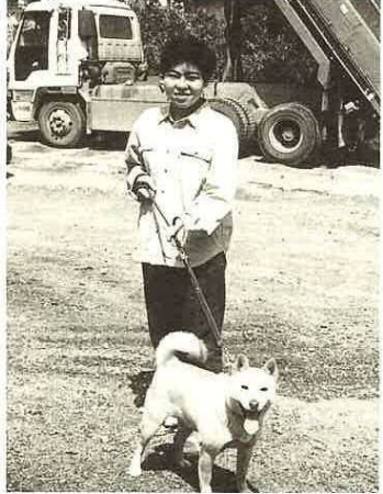
▲飼い主は責任をもって

動物を大切に飼っている人が増えているにもかかわらず、市役所・保健所にはたくさん動物に関する苦情が寄せられています。あなたのペットは周りの人に迷惑をかける