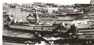
海苔養殖の最盛期。

厳寒に活気づく 富津漁港 早起きをして、まだ夜の明けないうち富津漁港を歩いてみた。寒さが肌を刺す。浜はすでに活気づいており、漁にむかって何隻もの船がけたたましいエンジン音を残して沖へ出て行く。漁港の東側にある灯台は、出ていく船の安全を見守るようにきれいな緑色の光を放っている。 浜辺には、あつちこつちにオレンジ色の炎が勢いよくあがっているのがみられる。その一つに近づいてみると、漁師たちが火を囲い暖をとっている。 わたしも、ちよつと仲間に入られてもらって冷たい身体をあたためる。今は、海苔養殖の最盛期。