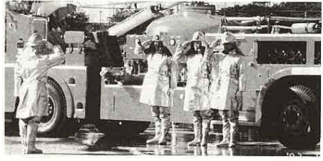
▲東電電力化学車も出動

・団旗の入場が始まった式典には、消防団と消防署職員872人が参加。近隣の市町村長や市民など大勢の人たちが見守るなか、人員報告、服装・機械器具点検が行われ、ポンプ操法や東京電力化学車による放水演技などが披露されました。 特に、富津保育園園児の幼年消防隊の演技や35台の消防車両による分列行進には、見学の入たちから大きな拍手が送られました。 最後は、消防職・団員による、大震災