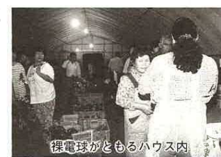
裸電球がともるハウス内

市に出す野菜を袋詰めして、朝は家族の朝食を整えてから家を出るので、眠る間がないそうです。ビニールハウスの中は、両側に置かれた台の上に13軒分の番号札が下がり、その下に各農家の野菜が並べられています。ビニール袋に入った野菜にも番号と値段が付られています。1袋100円が基本。6年前から値段は変わっていません。売上げは、1日で10万円を超えることもあるそうです。土曜市の人気は、トマト、メロン、スイカなど。切り花も人気の一つ。人気があつたという間に売り切れしてしまいます。取れたて野菜の新鮮さと値段の安さで好評な商いが続いている「土曜日」。