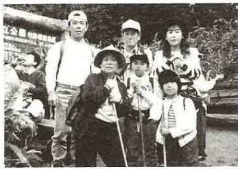
私共夫婦と孫で「市民ハイキング教室」に参加申し