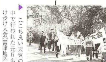
恒例の新春スポーツ大会が開催されました。

富津ライオンズクラブ主催の第15回青少年新春武道大会は、1月7日総合大会体育館で行われ、空手、柔道、剣道、少年大会、成人大会、熱戦がくりひろげられました。