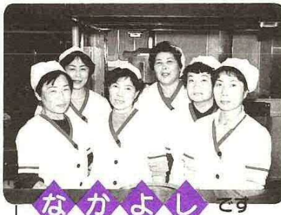
市役所レストラン「四季」調理員の皆さん