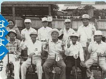
岩瀬第3長寿会チーム 全員集合!

平均年齢 自称35才のながよしゲートボールチームです。毎週3回、日水金こぼれしい練習日。今日は広報が取材に来たという事で出席率はグッとアップしたとか。皆さんのどの顔も色々々長く本当に健康そう、いつまでもお運者で楽しく動んでください。