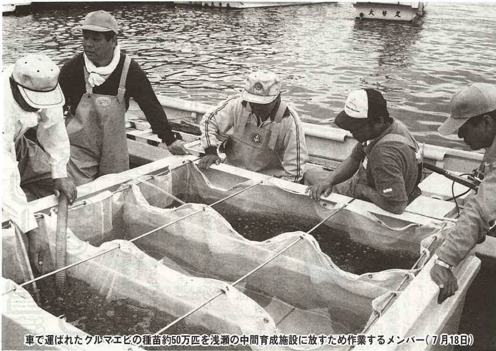
車で運ばれたクルマエビの種苗約50万匹を浅瀬の中間育成施設に放すため作業するメンバー(7月18日)

編集発行／富津市役所企画課 ☎(0439) 80-1225 千葉県富津市下飯野2443番地 千293