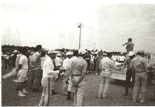
海岸清掃開始前のセレモニー