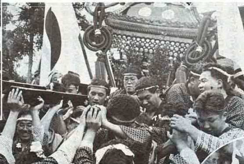
躍動する若い力(萩生のみこし)