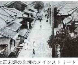
大正末頃の岩瀬のメインストリート