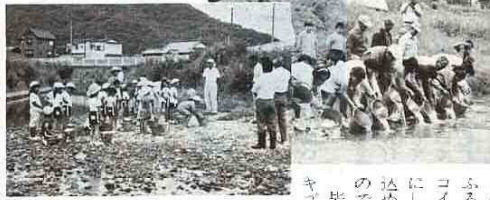
(右) 漢川で(天神山小全校児童) (中) 桑川で(佐賀小4年生児童) (左) 白狐川で(竹岡小1年生児童)