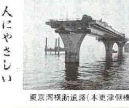
東京湾横断道路(木更津側橋梁工事)

地域に密着した道路 地域の人びとのふれあい、その「つながり」の役割を果たしているのは、昔からの一本の道路です。暮らしが豊かになり、便利になって、生活の基盤となる道路は、人びとの生活を守るため働いてきました。写真の岩瀬の道路も、そんな生活に密着した地域の道路です。