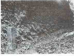
今も残るかまくら道と涼するべ(相野谷)

「かまくら道」は、「いざ鎌倉」という言葉があるように坂東武者が鎌倉にはせまる道でもあったのです。