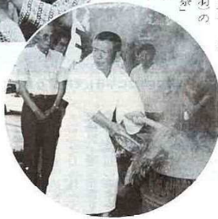
東大和田の「湯立て」