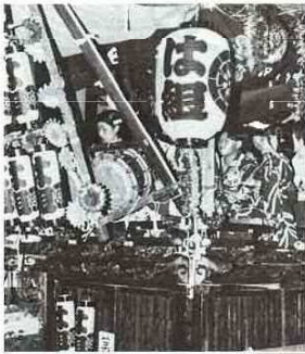
笛や太鼓でにぎわった小久保の祭礼(山車)

市内のお祭りは7月、9月、10月に集中し、漁業を営んできた海に近い地域では7月の時期が多く、農業が中心だった地域では五穀豊穡の意匠から、9・10月のお祭りが多いようです。中には、ユニークな大田利(天羽)の「大食い祭」や、東大和田(天羽下)の「湯立て」の祭礼が有名です。