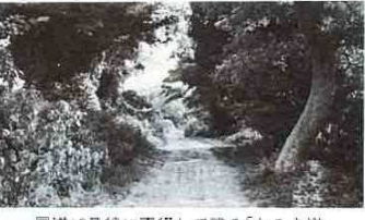
国道16号線に平行して残る「なみき道」