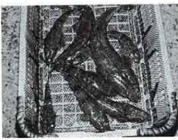
体長50cmのコチ、ちり鍋が美味

江戸時代には、コチには毒があるように言われていました。「本朝食鑑」には、昼飯に煮たコチの切り身を4、5片食べて中毒した話が載っていますが、同書をはじめ「魚貝能毒品物図考」や「食物和歌本草」には、眼を患っている人をは食べてはいけない、コチを食べて眼を患うというようなどことが書かれています。 コチの眼が楕円形で、しかも腫の形が半月形やハート形、枝散れしているものもある。昔の人がコチを食べると、眼を患うと考えたのめわから、眼を患うが考えました。もちろん、これは迷信で、食べてみればコチはうまい魚だし、今日では結構高級魚の一種に数えら