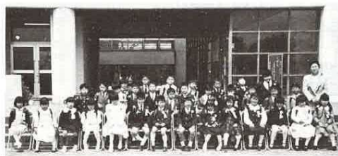
上 湊小の新入生 右 富津中入学式へ