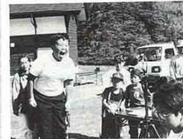
オリエンテーリングでゴールした朝から大雨大会

青少年の健全育成を目的に 10月24日、第22回あすをま す青少年つどい大会が、市民 の森で開催されました。 当日は、雲ひとつない青空 がひろがり、市内各地区から 小・中学生のグループや家族 づれで約400名が参加。美 しい自然に囲まれた野良の森 へのオリエンテーリング(み つけよう恐竜のたまご)が行 なわれました。 午後は、アキつみ、長な わとび、輪をば、紙こわき飛