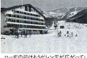
ロッジの前はもうゲレンデが広がっています

教育委員会では、市民のスポーツを通じた健康づくりと親睦を図るため、第19回市民スキー教室を開催します。レッスンは、初めてスキーをする方から上級者まで、レベルに合わせて行い、楽しみながら技術の向上を目指します。ゲレンデがみなさんを呼んでいます。 参加費 37,000円 募集人員 40名(先着順、初心者大歓迎、年齢性別は問いません) 申し込み 12月20日(月)から受付付けます。 申し込み先 教育委員会保健体育課 80-1344