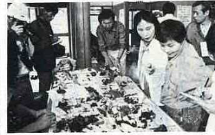
採取したキノコの名まえをもう一度確認

森林インスト ラクター等鳴 春さんの指導の もと10月23日 市民の夜間近 約30名が参加し て、キノコの観 察会が行われま した。 参加者たちは、 約2時間、秋の 味覚探しをしま した。採取し