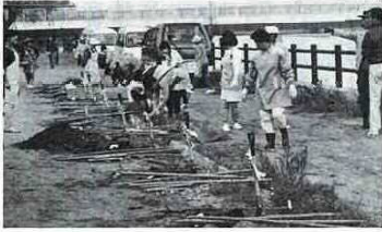
植樹の準備をする天窓商工会婦人部のみなさん

天窓商工会婦人部では、地域活性化のひとつとして、このほど一戸一戸運動を展開。これは、市西部を流れる湊川の護岸に桜の苗木を植え、美しい並木道を作ろうと、3月から一口二〇〇円で募金活動を始めてきました。その結果、397人の賛同者から募資金が集まり、それをもとに11月7日、桜の苗木150本を植樹しました。 当日は、婦人部会員をはじめ約70人が参加。富津警察署の護岸をJR鉄橋まで約600メートルに八重桜を植樹しました。この運動は引き続き行われ、鉄橋から4キロメートル上流の天湊橋まで植樹をする予定です。 植樹に参加した方などは、桜の名所として、みなさんが訪れることを期待しています。また、何年後かが楽しみです。などお話ししていました。 また商工会婦人部のみなさんは、市民憲章「花いっぱい運動の花植にも協力。天窓地