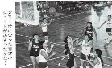
女子1位になった吉野小

11月4日・5日の 両日、総合社会体育 館で市内小学校のミ ニバスケットボール 大会が行われました。 日ごろの練習の成 果を十分に発揮した 選手のプレーに声援 の声が体育館にひび きわたっていました。 結果は次のとおり (男子) 1位 吉野小 2位 北野小 3位 飯野小 天神山小