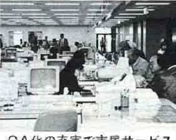
OA化の充実で市民サービス

とき/平成5年2月5日 日出/午後1時 ところ/中央公民館 講演/演題「イキイキ人生おもしろ楽しく」