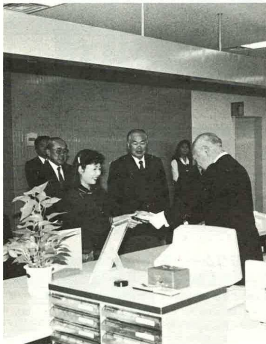
来庁者に証明書を渡す黒坂市長

セレモニートとして、黒坂市長の開庁宣言のあと来庁者を加えてのテープカットが行われ、8時40分のオンラインシステムが開始