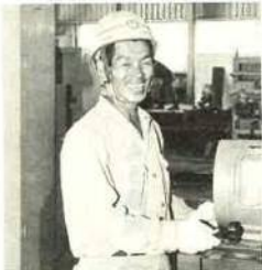
案内は金木南さん(富津2401-123)にいただきました。

君津支店富津エンジニアリングセンターは、平成3年1月に油圧ユニット製品の設計製作を進める「ユニット棟」