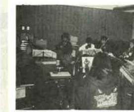
コンサートの成功と練習にも熱が入る一麦会のみなさん

一麦会(天羽ウインドミル)クリスマスミニコンサート 日時/12月19日(土)午後3時30分 場所/市民会館 内容/小・中・高校生が弦楽器を中心に、日ごろの練習の成果を発表します。 曲目/トロイメライ、砂漠の遂商、大協奏曲第8番(クリスマス協奏曲) 湊小音楽クラブも特別参加します。ご家族そろってお出かけください。