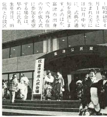
昨年の成人式から

新しく成人される方を祝福し、みなさんの将来の幸せを願って平成5年1月15日、富津市民館で成人式が行われました。 市内に住居登録されている新成人者、昭和47年4月2日・昭和48年4月1日までに生まれた方には12月中旬に、式典の通知を送ります。そのほか、富津市出身で、市外在任の方が成人式に参加を希望する場合は、早めに氏名、生年月日、旧住所と行政区