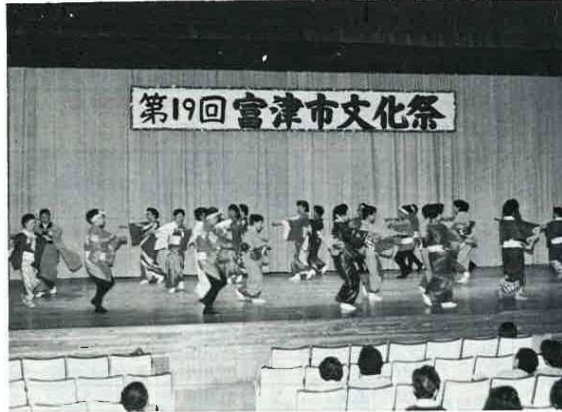
昨年の文化祭から