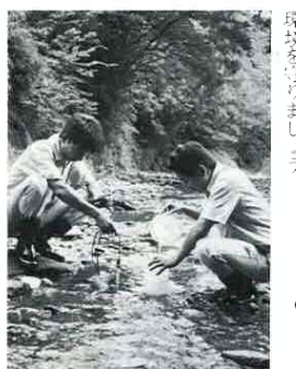
河川水質調査採水地点 (9河川15箇所)

大きなものとしては、下水道の整備、合併浄化槽の設置があります。身近なところでは、台所ごみ、紙袋をつけた三角コーナーを流さないこと、食器や鍋などの油汚れは紙でふいてから洗うなど、家庭でできることも大切です。工夫と実践で私たちの生活環境を守りましょう。