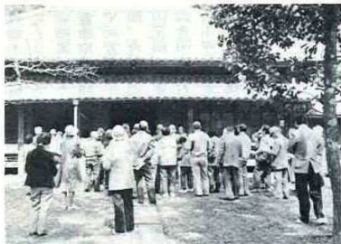
バスで現地見学(昨年)

本をご利用ください。返却は、長に借りたままだから、返却しにくい。など、心配はいたしません。返却しなからまた新しく返している