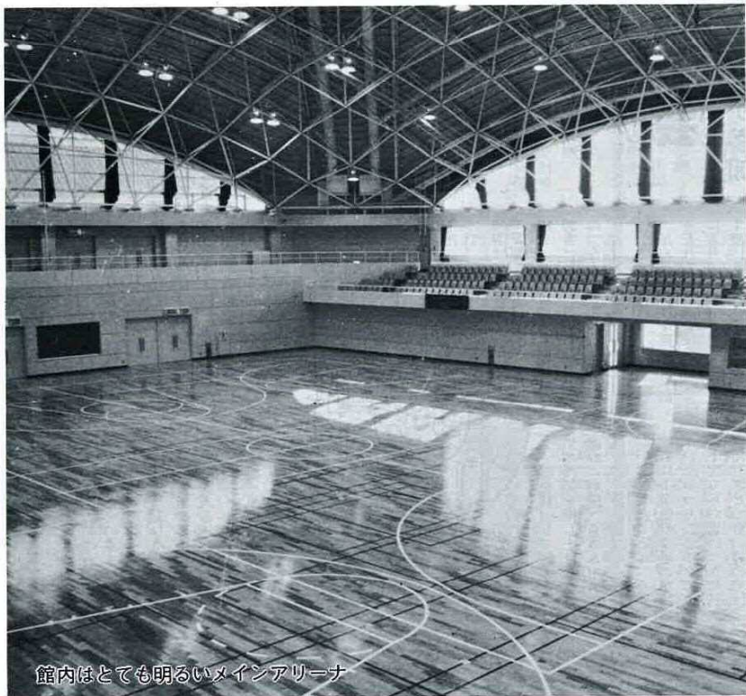
館内はとてもしゃるいメインアリーナ

編集発行 富津市役所秘書課 〒299-16 千葉県富津市湊260 電話 (0439) 67-0511