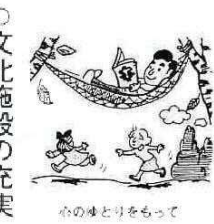
心のゆとりをもつて

文化の日には、富津市でもさまざまな行事が行われました。これは参加された人びとの数も、年ごとにならないうえ、今年は大変な数になつていまして、経済的安定が余暇を生み、その余暇が文化への関心となり、そして心のゆとりと豊かさを育て、新しいサークルの輪をひろげていくので