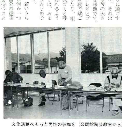
文化活動へもつと男性の参加を(公民館陶芸教室から)