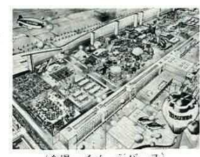
(会場イメージパース)

食と緑の博覧会 ちば'90(愛称'90ちば博覧会)が11月18日~12月16日までの29日間、幕開メッセで開催されます。