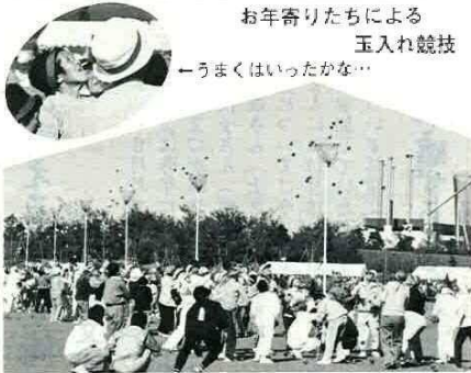
お年寄りたちによる 玉入れ競技 —うまくはいったかな—