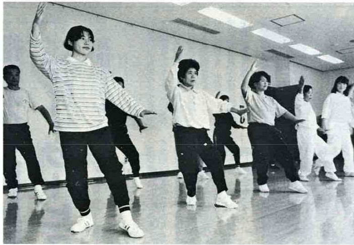
呼吸をしっかりと静かにポーズを (太極拳サークルに参加のみなさんの真剣な眼)

11月はめでたい月です。3日の文化の日、9日の太陽暦採用記念日、15日の七・五・三、23日の勤労感謝の日と、わたしたちの周囲には、さまざまな行事が行われます。特に今年には、12日の即位の大典をひかえて、国家的にも誠に意義深い月です。こうした時に、わたしたちは日本の文化と伝統に、深く想いをひそめてみることも、また大切なことではないでしょうか。