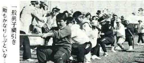
一般男子綱引き 「敵もかなりしぶといな」