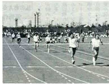
小学生女子リレーの決勝

10月10日第3回市民体育大会がふれあい公園陸上競技場球技広場を会場に行われ、総勢3000名の参加者が熱戦をくりひろげました。 結果は次のとおりです。 (成績結果)