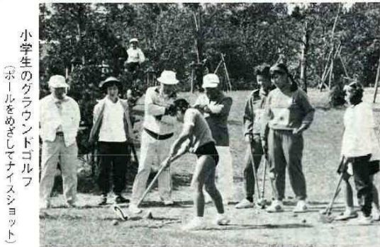
小学生のグラウンドゴルフ (ボールをめがけてナイスショット)