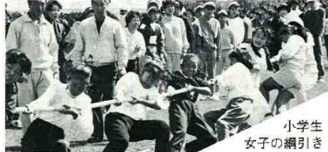
小学生女子の綱引き 「いっきに引っこー せーの!!」