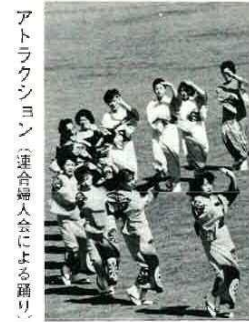
アトラクション(連合婦人会による踊り)