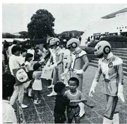
昨年の催しものターボレンジャーショー

君津郡市では、富津公民館を会場として次のようなイベントがあります。家族そろって参加してみませんか。入場は無料です。 とき/6月16日(土)午前11時から、屋内は午後12時20分まで。 ところ/富津公民館および駐車場。