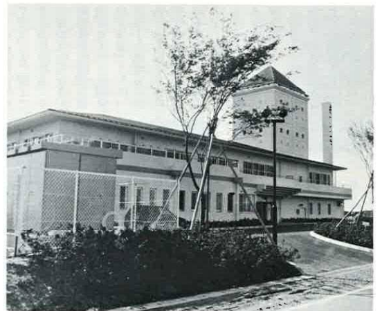
飯野小学校隣りにオープンした特別養護老人ホームつつじ苑全景