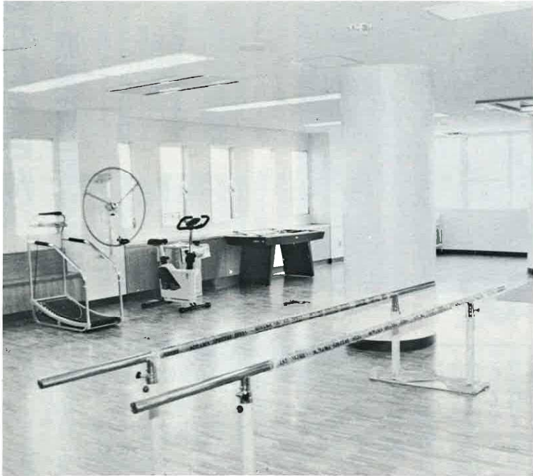
機能維持の器具をそろえているデイ・サービス室(つつじ苑)

現在、市内の高齢者は65歳以上が8161人、高齢化率14.7パーセントで年々その割合が高まり、ひとり暮らしの老人380世帯、老人のみの世帯271世帯、ねたきり痴呆性老人を含む世帯110世帯、特別養護老人ホームやその他の施設への入所者120人、それぞれが年々増加しています。