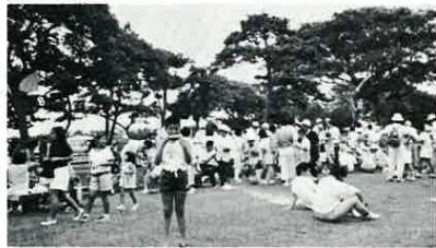
昨年実施された歩け歩け大会

日時/7月8日(日) 前9時集合(小雨決行) 集合場所/富津公園 駐車場前 コース/富津公園周 辺約5キロメートル 参加対象/子どもから高齢者までどなたでも参加できます。 ※特別メニューとして宝さがしや甘いスイカの食べ放題などが用意されています。ご家族おそろいでご参加ください。