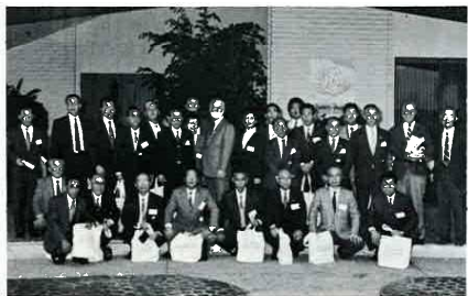
昨年秋の国際交流海外派遣団一行、カールスバッド市長と一緒に...

テーマ/「私の考える国際交流」 応募資格/市内在住の方。 (過去に市の海外派遣団として参加された方は除きます) 応募方法/400字詰め原稿用紙5/6枚程度で自作のもの。 締め切り/7月31日 必着 送り先-問い合わせ先/市役所企画部企画課 〒299 16富津市湊260番地 ☎670511 内線263