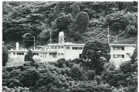
戸面原ダムを望む恵まれた環境 の中に建つ、成人の精薄者を対象 とした豊岡光生園