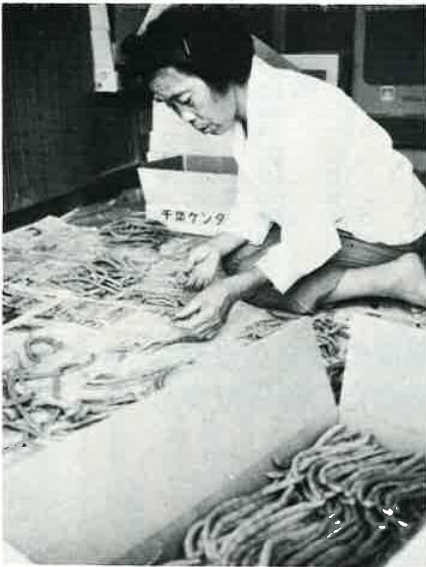
いんげんの荷作り(梨沢)