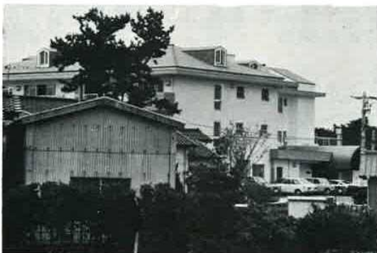
富津に建設された、寝たきり老 人を対象の紫苑荘

皆さんの家庭には いつとどくのかな 市内でも店頭をにぎわす 多くの野菜、くだものが生 産されています。