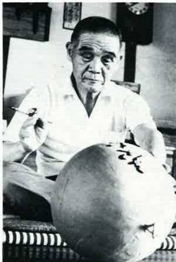
玉名を入れ完成の尺玉に、はりつめた作業中の表情がしばし和らぐ