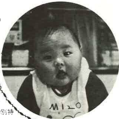
後日回覧で希望受付をします

◎四歳~入学まで 日常生活の身のまわりのこともでき、友達との遊びも盛んで約束やルールも守り、お手伝いもできます。食事は、手だすけなしで一人で食べますが、食べるのが遅い子は、遊びながら食べないようにし、幼稚園などには、お弁当の量を少なくしましょう。友達と食べるようになるので、段々おつてくるようになります。