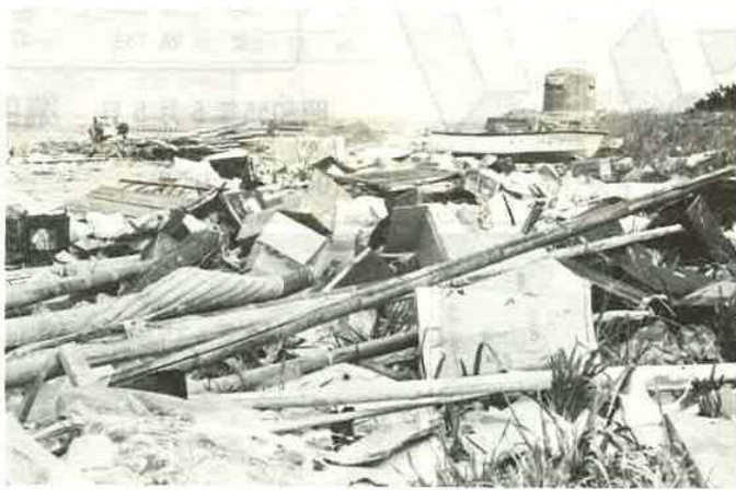
富津公園北側海岸に捨てられたゴミの山

富津市は優美な海岸線と鑑山・大坪山・高岩山などの山系に囲まれ、恵まれた自然を持っています。市の施策の中にも、これらの自然を生かした通年型観光が、新しい指標として掲げられています。しかし、この美しい自然が実際に保たれては、一日平均約1キロといわ