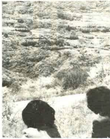
マザー牧場からも一望

とは言え、この地区には二つの顔があります。一つは大森、押切、関尻、上後の、鴨川に至る県道沿いの部落。一つは六野、田原、山脇、小志駒、岩本の県道からはなれた地域。県道沿いの部落は、人家も多く、商店も少なくありませんが、県道からはなれた地域は、山ひだの間に水田が開け、山裾に人家が点在する農村の面影を見せています。つまり県道沿いは商業地帯、他は農村地帯とも言えるでしょう。殊に、鴨川と小糸に県道が分かれる関尻、上後地区は、小中学校、保育所、公民館、市役所出張所、郵便局、農協支店などが集まり、文教行政、経済の中心となっています。