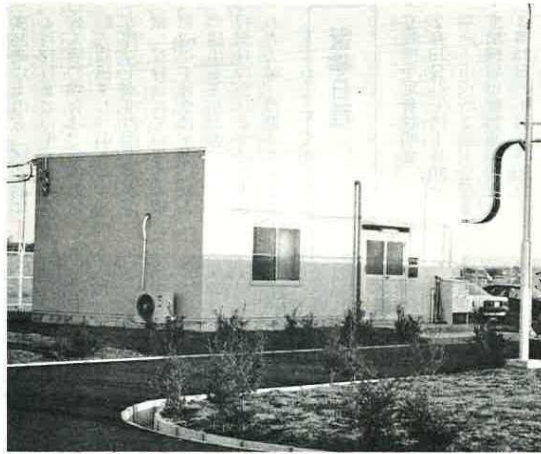
汚水処理を管理する管理棟

富津沖埋立地の一般廃棄物最終処分場の隣りに、昭和62年6月から建設が進められていた汚水処理施設が完成し、1月21日、しゅん工式が行われました。この施設は、環境センターで処理されたゴミの灰や不燃物残さを投棄する最終処分場の汚水を処理する施設で、総面積5408平方メートル、総工費1億2400万円をかけ建設されました。