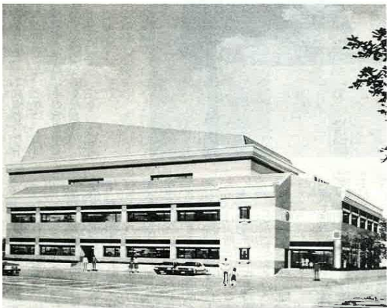
市民会館の完成予想図

生活水準の向上・余暇の増大など、芸術・文化に対する市民のニーズは、次第に高まるものになっています。そこで市では、天羽地区の芸術・文化の中心となる活動の場として、現在ある市民会館の約半分ホール部分を改築することになりました。昭和47年度に大佐和に中央