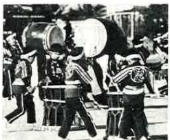
富津保育園の元氣な演技

消防に対する理解と信頼を深めてもらうと、富津市消防出初式が、1月9日富津公園駐車場で行われました。 当日は、富津保育園と明澄幼稚園の幼年消防クラブ220人が元氣な演技を披露し、出初式に花を添えました。また式の中で、永年にわたる消防業務に功績のあった消防職員