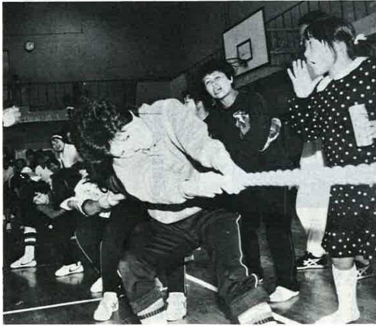
大健闘の天神山オッカーズ一般女子綱引き