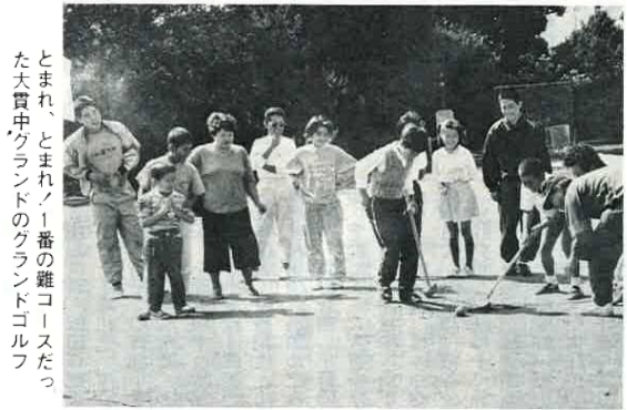
とまれ、とまれ1番の難コースだった大貫中グラウンドのグラウンドゴルフ