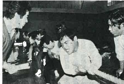
力よりチームワークが目立った一般男子綱引き