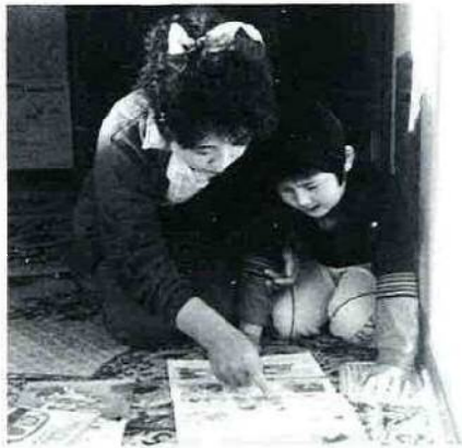
①絵や本を見て説明するだけではなく、現場で実際に指導する。