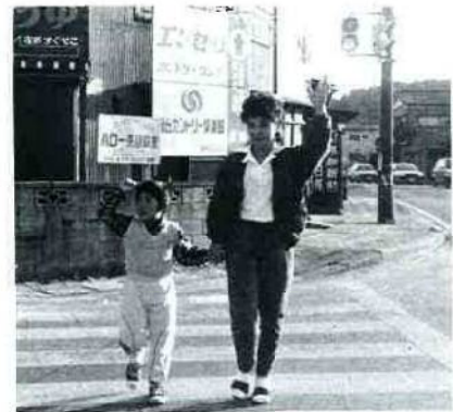
③横断歩道を渡る時は、よく右と左の安全を確認すること、目の前の自動車は止まっても、そのかげからは追越しの車が出てくることを教えてください。

もうすぐ新学期です。期待に胸をふくらませながらお母さんもお子さんも、何かと準備にお忙しいことでしょう。入学準備の中で最も忘れてはならないのが、お子さんに対する交通安全です。お子さんを交通事故から守るために、家庭でのしつけの一つとして、家族の方が正しい知識を身につけさせ、自らが手本となるような行動をして、交通安全に努めましょう。