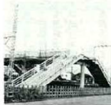
ほぼ完成し渡り初め式を待った

昭和61年9月末から工事が進められていた、内房線青堀駅構内跨線人道橋がほぼ完成し、3月24日渡り初め式が行われます。