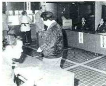
投票日には、あなたの貴重な一票を

昭和62年2月28日までに市内で住所を変え、同日までに住民票の転居の手続きの済んでいる方は、転居先の投票所で