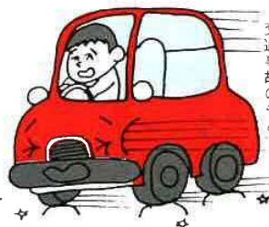
冬の間の水まきは交通事故のもと