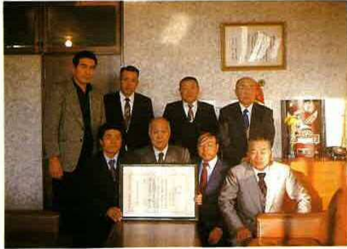
市長報告に訪れた吉野のり生産組合長ほか