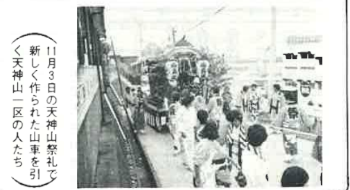
11月3日の天神山祭礼で新しく作られた山車を引く天神山一區の人たち