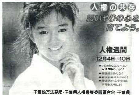
千葉地方法務局・千葉県人権擁護委員連合会・千葉県

人間は、だれでも「幸福な生活を送る権利」を持っています。これが人権といわれるもので、人間が人間らしく生きるためになくてはならない権利です。 法務省と全国人権擁護委員連合会は、この大切な権利を守るために努力していますが、特に、毎年12月4日から10日までの1週間を「人権週間」として、人権についての正しい理解と相手の立場を考えた明るい社会を築くため、関係機関の協力を得て全国で講演会・座談会・映画会・特設人権相談所の開設など、各種の行事を行っています。 みなさんが、これは人権問題ではないだろうかと感じたり、困りごとや心配ごと、子供のいじめ問題での悩みごと