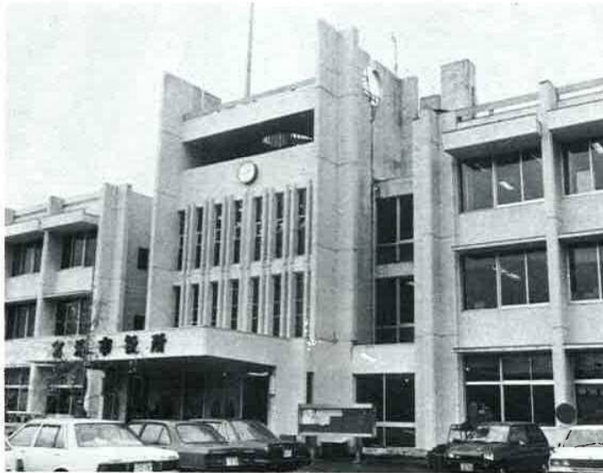
行政改革の核となる市役所本庁舎

市では、今まで行財政運営の効率化を目指して、積極的に行政改革に取り組んできましたが、このほどさらにより簡素で効果的な行財政を確立するため、「富津市行政改革大綱」を定めました。