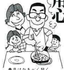
食品はなるべく早くよく火を通して調理する

食中毒とは、一般的に細菌や有毒な物質のついでに食品を食べたおこりの病気で、腸炎ピブリオ・サルモネラ・ブドウ球菌などの細菌によるものが多く見られます。細菌性食中毒の主要症状は、