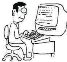
市役所の事務もO.A化時代

○行政改革推進にあたっては、地域社会の活性化と市民福祉の増進を図るため、行政改革推進委員会の答申を尊重し、機会と連携しつつ全庁が一体となって取り組みとともに、市民の皆さんのご理解とご協力が得られるよう推進します。 ○改革方針として①事務事業の見直し②組織・機構の簡素合理化③給与の適正化④定員管理の適正化⑤民間委託・オフイス・オートメーション化等事務改革の推進の五項目を重点項目として定め取り組みをこととしました。