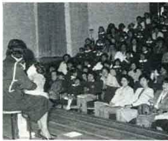
ユーモラスな腹話術に子供たちも大喜び

式には、富津保育園ほか9施設、約300人の親子が参加して、市交通指導員による腹話術の模範演技、映画「アラレちゃんの交通安全」富津保育園児のミュージックケルなどの演奏が行われ交通安全意識を再確認しま