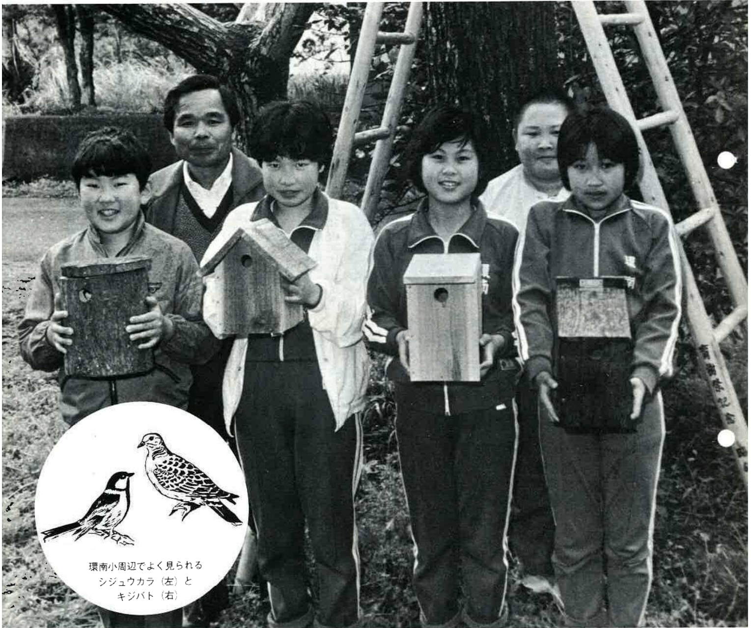
環南小周辺でよく見られる シジュウカラ (左) と キジバト (右)

編集発行 富津市役所秘書課 〒299-16 千葉県富津市湊260 電話 (0439) 67-0511