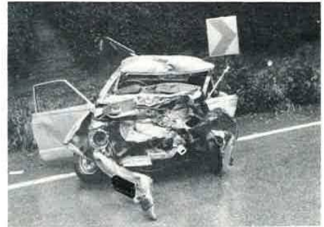
交通事故にはくれぐれも気をつけて