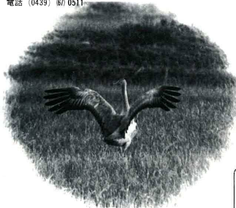
昨年の十月中旬富津市西川に 渡来したカナダヅル

— カナダヅル — アラスカ北部・カナダ北部 か中部に分布し冬は南下する。 日本には冬鳥としてまれに渡 来する。体長は約1メートル の小形ヅルで、頸から頭部 にかけて赤色で後頸から頸は青 灰色、喉は白く体は灰色。