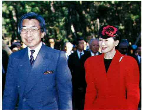
▼ 楽しく談笑されながら展示物をご覧になる皇太子ご夫妻