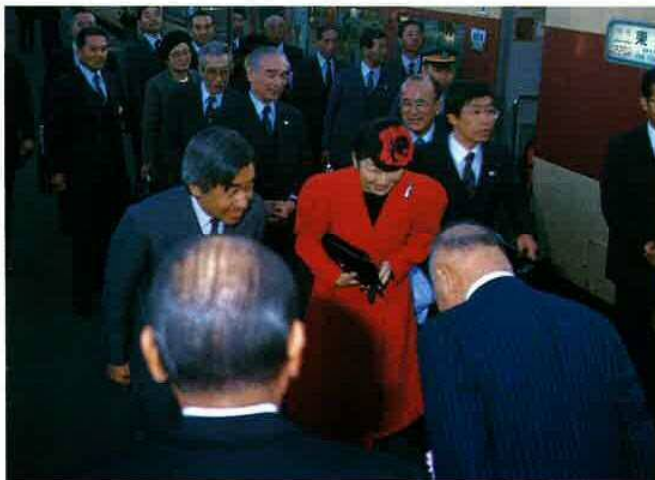
▲ お別れのごあいさつをされる皇太子ご夫妻 (大貫駅)