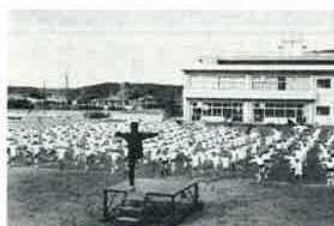
なのはな体操で健康・体力づくりの輪

吉野小学校では、体育活動の中で積極的になのはな体操を取り入れ、健康・体力づくりの輪を広げたいとして、昨年の10月13日千葉県知事から表彰されました。また11月29日には、吉野小学校で千葉テレビによるなのはな体操の録画撮りがありました。放送日は次のとおりです。