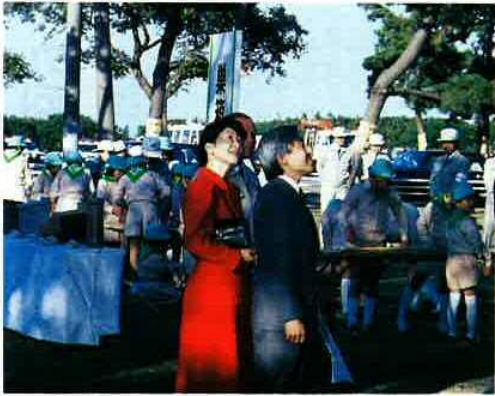
▲ 巣箱 かけをご覧になる皇太子ご夫妻