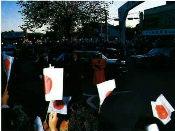
▲ 行くさきざきで熱烈な歓迎 (大貫駅)