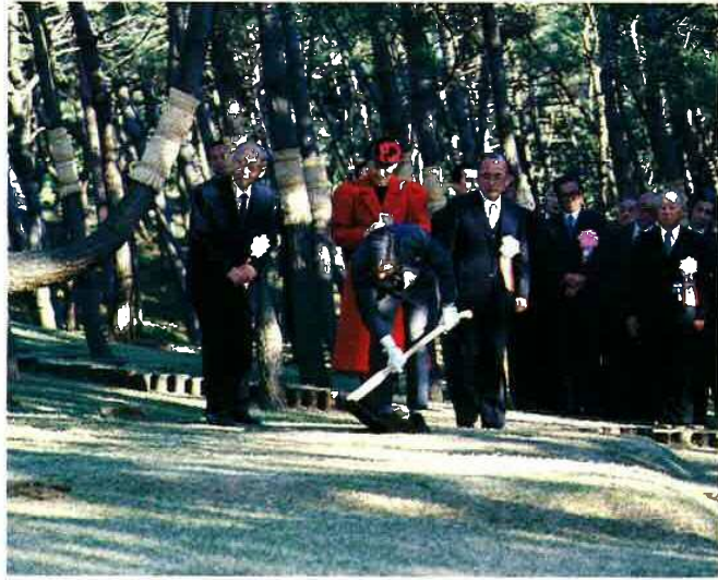
▲ むつまじく施肥される皇太子ご夫妻 (お手植えの松記念碑)