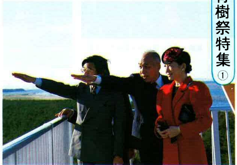
▲ 保安林の様子をご覧になる皇太子ご夫妻 (富津岬荘屋上で)

小春日和の昨年十一月十九日、皇太子ご夫妻は、第九回全国育樹祭にご出席のため富津市を訪れました。ご夫妻そろっての来市は、十五年ぶり二度目で、富津市民の歓迎は前回にも増し行くさきさきで熱烈なものでした。富津公園では、昭和二十八年に天皇・皇后両陛下がお手植えになられたクロマツに施肥されたり、環南小学校緑の少年団全校児童三十五名全員による果樹かけの実演などをご覧になられました。また、式典終了後、富津岬荘に向かわれる途中、緑の少年団に自ら握手を求められ、思いがけないハプニングに子供たちは大喜びでした。 全国育樹祭は、全国から約五〇〇〇名の方にご参加をいただき、午前中は参加者全員による育樹作業。午後からの式典では、皇太子殿下が「緑育てる輪を我が国のいたるところへ広げられていくことを希望します」とお言葉を述べられ、参加者全員で「健全な緑あふれる森林を育成すべく、積極的に事業の輪を広げよう」と大会決議がされ、式典を閉じました。