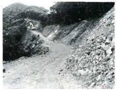
(工事が進む金谷芝崎地先)

ち、地主のかたがたのご理解とご協力で、二四〇〇メートル余りは今年度末までに竣工の予定になっています。受益面積は、金谷線沿線だけでも四三八ヘクタール。これまで未利用だった南房総森林資源の開発に大きな力となるでしょう。この路線は、泥岩地帯で地盤が堅く人家もなく、一時心配された環境破壊や公害の心配は少ないようです。その上路線は尾根づたいを通るので、眺望のよさはおそろしく県下随一でしょう。重なり合う遥かなる山なみ、対岸の伊豆・箱根・富士の連山も指呼の間で、見おろす東京湾の青波と行き交う船の姿は、さながらパノラマを見るようです。