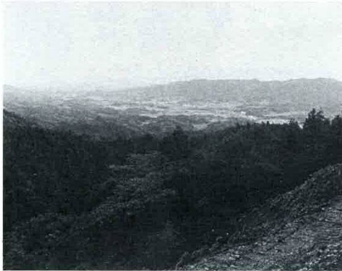
上総と安房の国境（豊岡の松節）から見る鴨川市内と太平洋 〔ここでは南部林業事務所の手で工事が進められています〕

金谷線は、国道一二七号線 系の背後を、たん銀南町元名に芝崎砲台山入口を起点とし、出て、更に東進して再び富津市の入り、保田見に至る九、五キロの路線で、工費は九億一千万円、昭和六十七年の完成を目指しています。このう