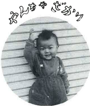
お麗雄くん(1歳2カ月)

また、酒類を提供する飲食 店経営者の方は、車を運転す るお客さんにはお酒を出さな いか、万一飲んだときは車 のエンジンキーを預かるなど、 真に思いやりのある配慮をし てあげましょう。