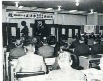
市役所3階会議室で行われた富津市表彰式