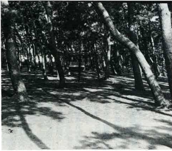
(雨の日も快適に利用できるようになる富津公園キャンプ場)

になつています。そこで、人と猿の関係、ふれ合い感とともども、また見る人が囲われているというマイナスイメージをなくすため、橋りょう状に観覧歩道を地面から高く離すことで人と猿との接触を制限し、かつ開放的視野で観察を楽しめるようにします。さらに、南房総国定公園の玄関である富津公園には、ただ今県と調整中ですが、富津にふさわしいシンボルにと、1500人収容の野外劇場をつくり文化交流の拠点とします。鋸山は東京湾の名所として多くの利用がみられますが土取場跡が放置されていて景観を著しく損ねています。修復対策としては、樹木の植栽が一番望ましく、「鋸山桜花園」