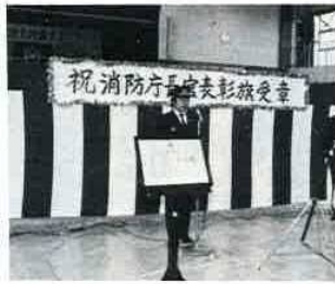
(表彰旗を披露する浜名副団長)

このたびの受章は、防災思想の普及・消防力の整備・災害の防除及び訓練等、平素における消防活動が高く評価されたものです。