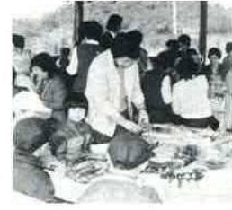
(温泉に入ったり、バーベキューをしたり楽しい1日を……)