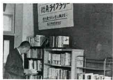
利用者を持つライブラリー

竹岡小にも誕生 だれもが身近かで気軽に借りられる街角ライブラリー。竹岡小学校の5番教室に誕生しました。本の数は約400冊、貸し出しは毎月1・10・20日の13時から16時まで。どうぞご利用ください。