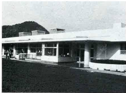
竹岡保育所の全景

によく考慮され、衛生設備も完備した新施設は、順次改善されている他の保育所と同様に、年齢に準じた保育ができるよう考慮されています。