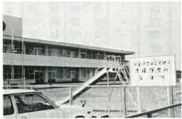
新設の青堀保育所

この資金の仕組みをお知らせします。積み立てられたお金は、皆さんの共同準備財産ですから、その運用に当たっては、安全有利、公共の利益にかなうよう配慮されています。このために国では、毎年度積立金の一部を県や市町村等へ一定の利率で貸しつけ、資金の効率的な運用を図っているわけです。