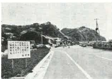
小久保の海岸線舗装新設