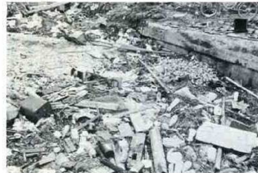
市の恵まれた自然が、美しい緑や清らかな流れをいつまでも保てるよう努力しましょう。