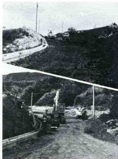
市道改良 (大森～蛭田線の拡幅工事)

市道改良は、新田―中線が昭和六〇年までの継続事業で、大森―蛭田線は五八年度まで、役場―青堀線が五九年度までの継続事業として計画されています。