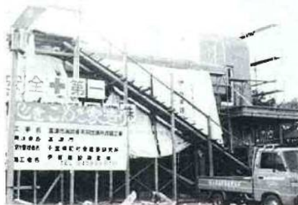
完成間近い消防署天羽出張所

この改良は、排ガス処理設備や灰出し設備などの内部施設に係るもので、調査設計費四四〇万円、工事費七七六七万円の総工費八、二〇七万円を要しています。 工事は昭和五七年一月に完了し使用が開始されています。