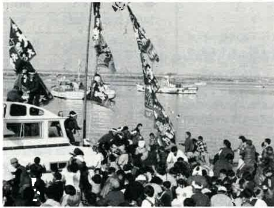
富津の船祝い風景

正月二日、持ち船に大漁旗をたてて祝う。船祝い。船主が投げるおひねりやみかんでポケットがふくらんだ