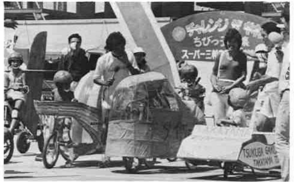
おーい、暑くないか！ 珍三輪車が勢ぞろい。これは、スーパー三輪車競争の一コマ。