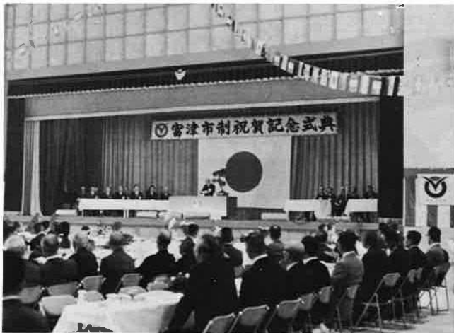
市制施行記念式典