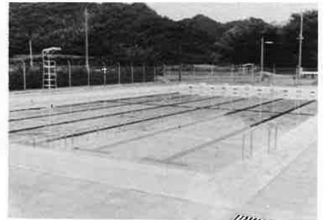
天神山小学校プール 昭和47年1月完成

富津市が誕生して、早くも10年の月日がたちました。 「光陰矢の如し」といいますが、10年の長い月日も、過ぎ去 ってしまおうと早いものです。しかし、町村合併・市制施行と 全て「無」から出発した富津市にとって、決して平たんな道 のりではありませんでした。 市が、京葉工業地帯の南端の都市として、ゆるぎない地位 を築くための、基礎づくりの10年だったといえるかも知れま せん。 昭和65年を目標年次とする基本構想も制定されました。今 年はこの10年を土台として、更に次の10年に向けて躍進する 記念すべき年です。 そこで、市では10月1日の市制施行10周年記念式典をはじめ めとする、数々の記念行事を計画しました。10年という一つ の区切りの中に刻まれた歴史をかみしめながら、この行事を 盛り上げるために、皆さんのご協力をお願いします。