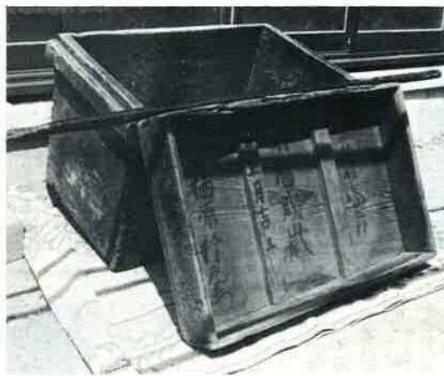
石井家に伝わる米びつ。一俵は入るといふ大きさです。

に表われてくるのは、景行天皇の五十二年(西暦一三三年)イワカムツカリノミコトをお祭りした神社です。このように、富津の貝が日