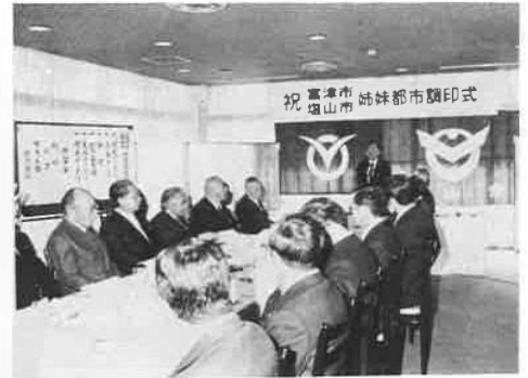
塩山市と姉妹都市協定 昭和52年12月1日

市章に市の木、市の花、そして富津市(千葉県)と横須賀市(神奈川県)を結ぶ、夢のかけ橋、東京湾横断橋を配したものだ。