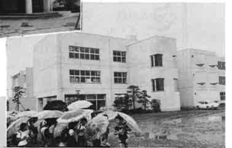
飯野小学校校舎完成 昭和48年12月