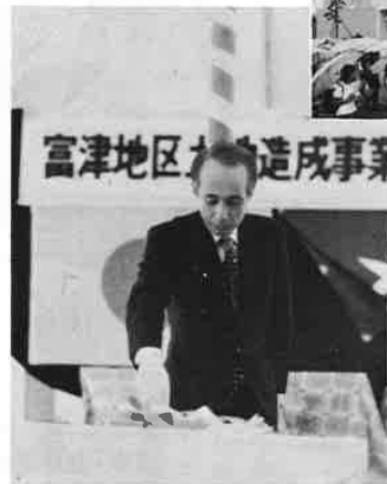
富津沖埋立事業はじまる 昭和53年4月