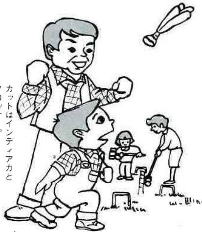
カットはインディアカとクロケット。