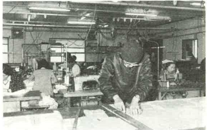
市内にある松葉屋縫製工場。ここでは、50人いる従業員の中で、身体障害の方が1割以上も働いています。もう7年も前から障害者への就職の道を開き、現在では職業安定所からの紹介も多くなったということです。通勤の不自由な障害者の方には寮も完備され、障害の度合を考慮した仕事を与えられています。

る方が約10000人、心の障害者が約4000人、障害者手帳を持たない人を含めると約15000人の人たちが生活しています。病気、交通事故、労働災害ストレスの増大など、私たちの周囲には障害の原因となる要素がまん延し、障害者は、毎日確実に増えています。このような状況の中で生活する私たちにとって、心身の障害は、決して人ごとではありません。