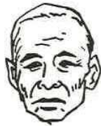
ここにちは市長です

幼いころからの障害のため、学校には行けなかつたのですが、好きな草花を自分で育ててみようかと独学で園芸を学び、植木や草花の販売もしています。