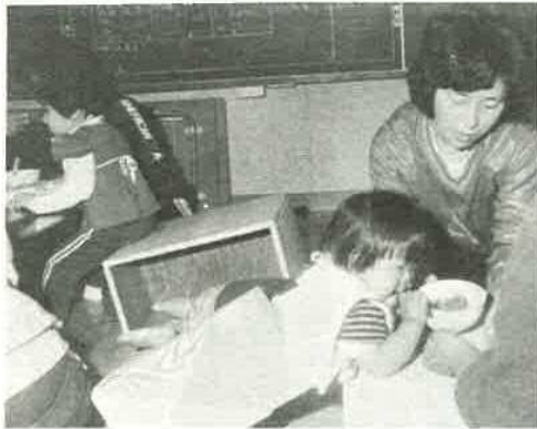
楽しい食事の時間も、訓練は続きます。それぞれの障害に合わせて考案されていて、食事中もたゆまない筋肉運動が続けられているのです。君津市にある「きみつあゆみ園」は、君津郡市の広域事業として作られた身体の不自由な子供たちの施設。ここでは、母と子そして保育(夫)さんが一体となつての回復訓練が行われています。

障害を持つ人たちの中には、ちよつとした社会の配慮や人々の優しさがあれば、自分で生活できる方がおおいいます。しかし、現状では、働く機会もなく家庭での役割もな